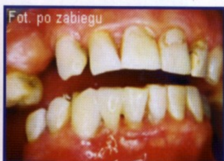
Przypadek 3. Uzupełnienie brakującego siekacza dolnego