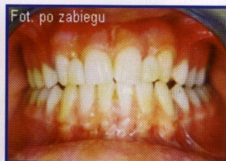
Przypadek 1. Uzupełnienie brakujących siekaczy bocznych